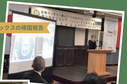
ローテックスの帰国報告