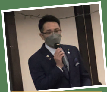
村田ガバナーの御挨拶