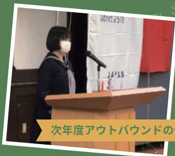
次年度アウトバウンドの候補生