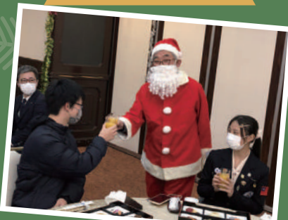
サンタ(高丹エレクト)とインバウンド学生