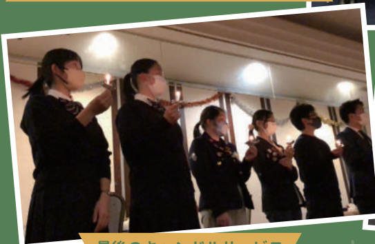
最後のキャンドルサービス