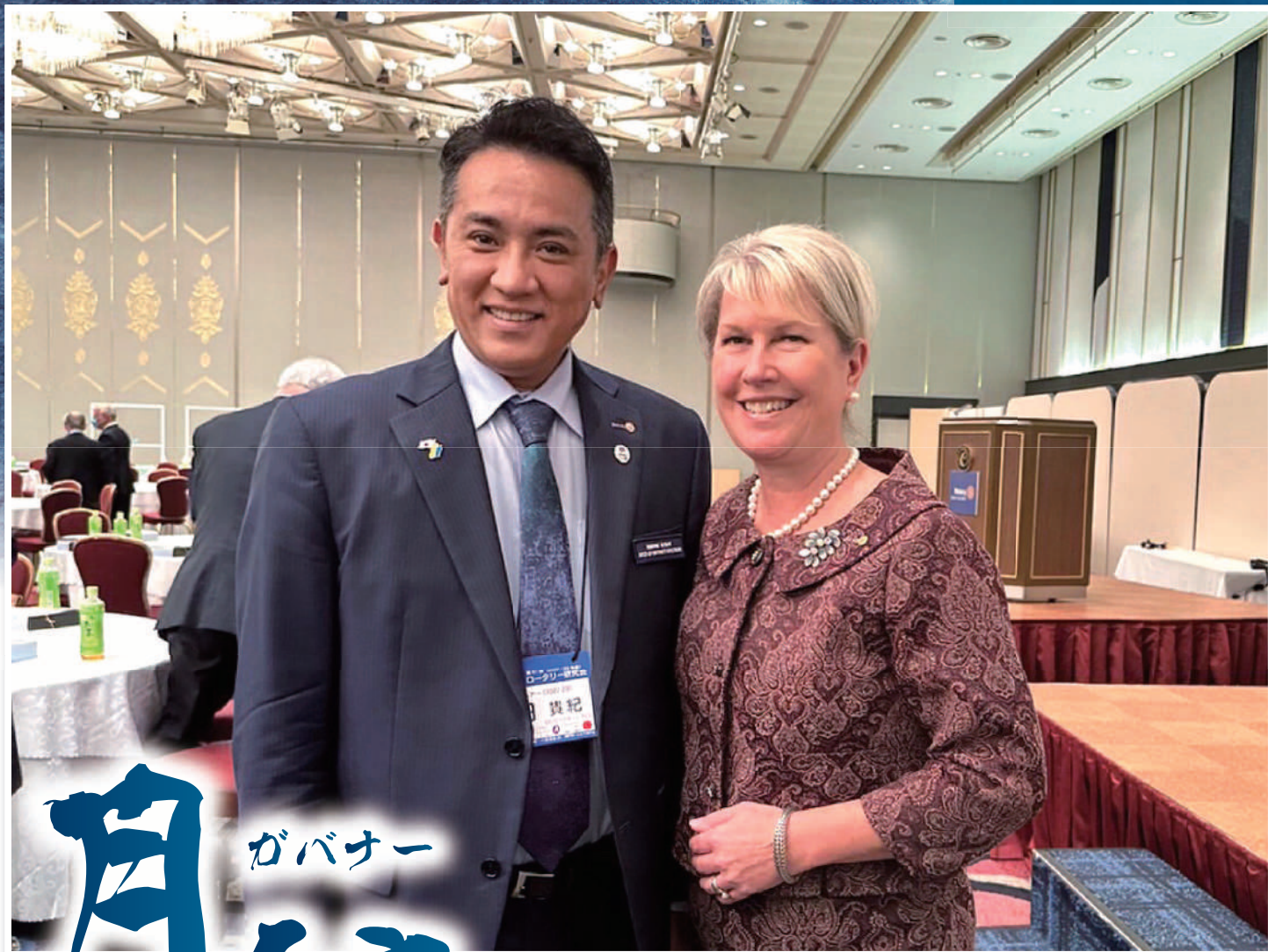
ジェニファー・ジョーンズ国際ロータリー会長と