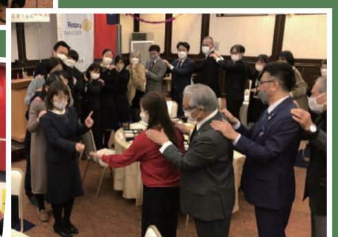
室内ゲームじゃんけん列車でプレゼント交換