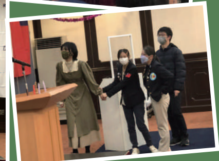
インバウンドの台湾からの学生たち