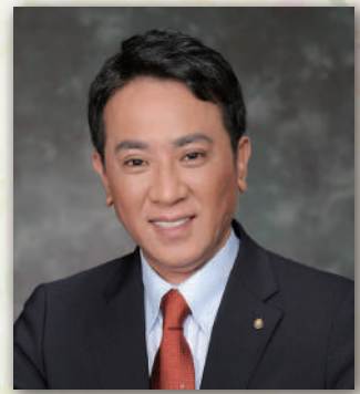
国際ロータリー第2570地区 2022-23年度 ガバナー

今月は「疾病予防と治療月間」となります。各クラブの活動に敬意を表するとともに今後の更なるロータリー活動に参考になればと思います。以下一部お話をさせていただきます。